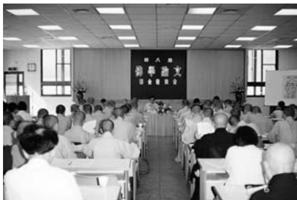
1997年9月5~7日法光佛研所主辦第八屆佛學論文聯合發表會

b. 「法光雜誌社」按月出版一期《法光》，為對開之報紙型刊物，每期四版一大張，第一版刊登所內外佛教活動訊息及短評專欄，第二、三版刊載短篇佛學論述，第四版經常刊出教界人物專訪。迄2001年底已出到第148期，完全免費贈閱，函索即寄。