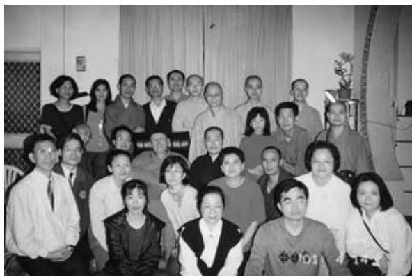
法光佛研所師生晉謁導師印順法師

a. 學生社團 成立讀書會，分「阿含經研究」、「藏語會話」、「現觀七十義研究」三組進行。