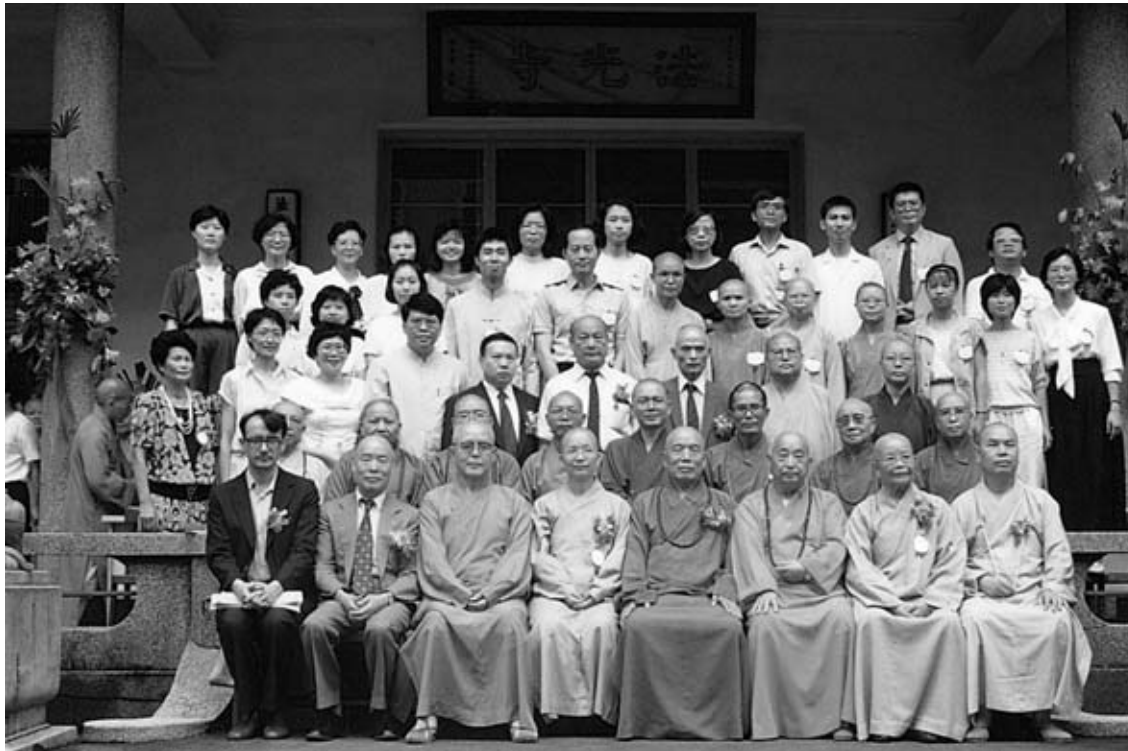
法光佛教文化研究所於1989年9月21日舉行開學暨法光新廈啓用典禮。參加典禮的來賓及佛研所師生合影

法師興辦教育之精神，乃發自百年樹人之弘願，期望能夠從此培育出更多更高級的佛教人才，以因應新世紀所需要的教內新人才。1992年元月30日法師捨報示寂。世壽八十春，僧臘六十夏，戒臘五十七秋。